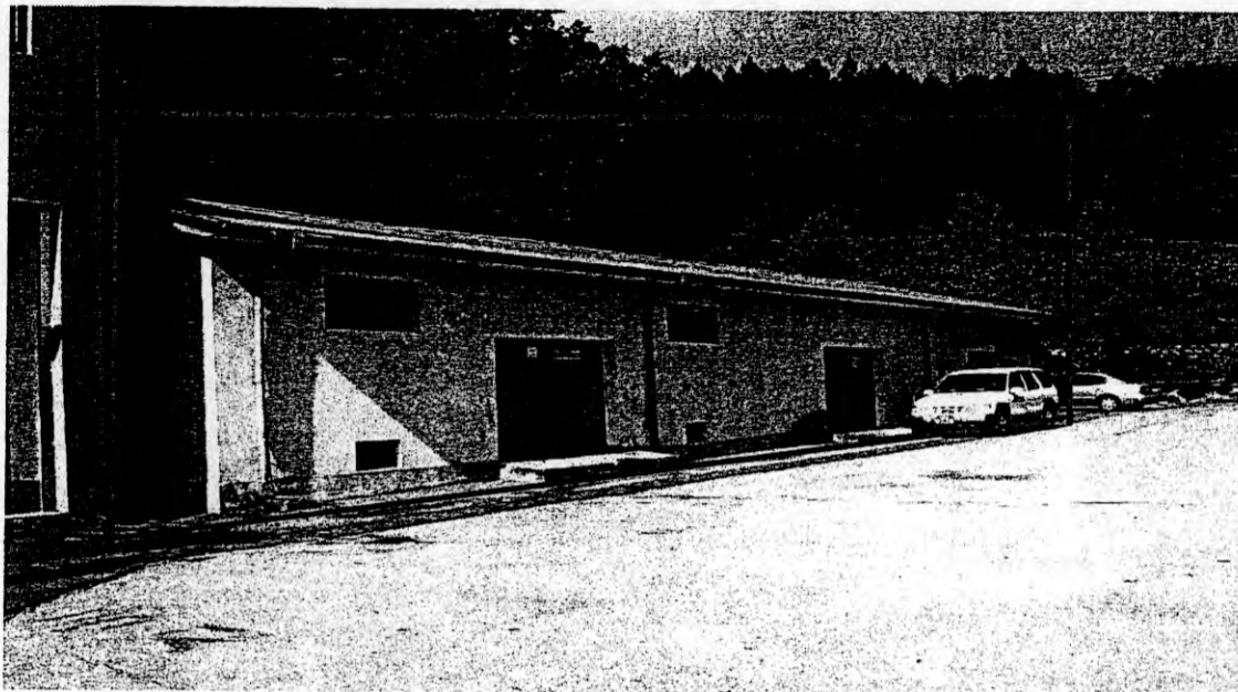
< 증축 대상건물 근경 >