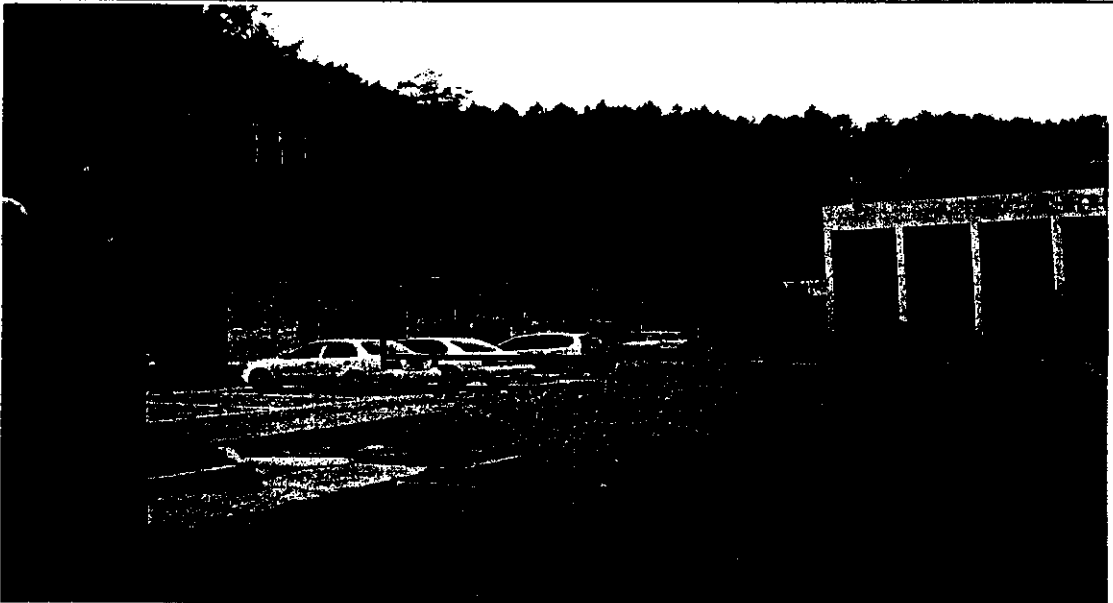
< 증축대상건물 원경 >