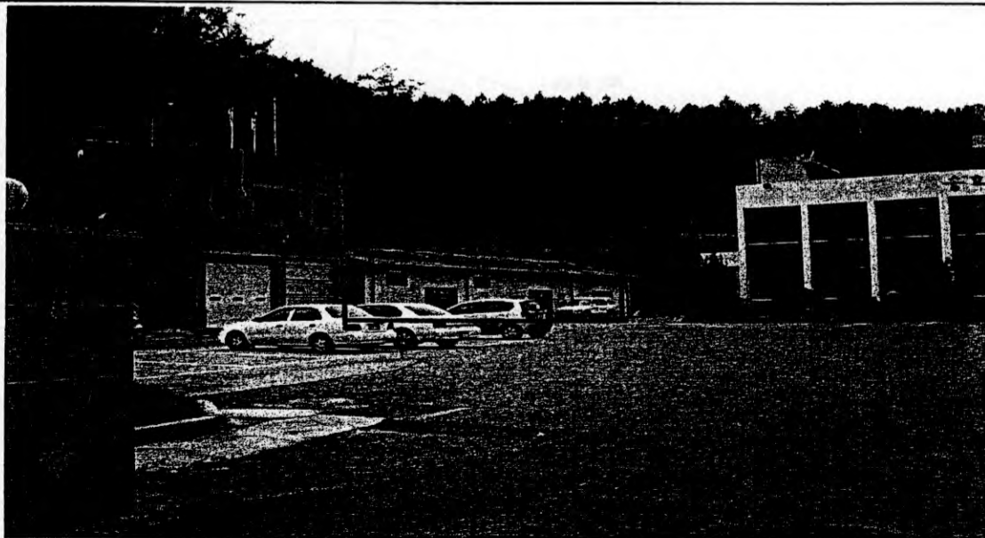
< 증축대상건물 원경 >