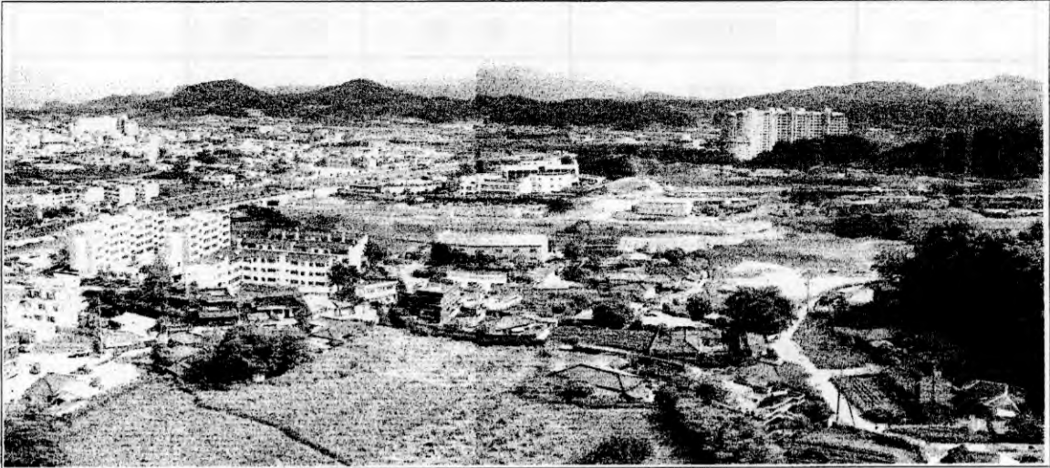
사진설명 : 공사중인 코아루 아파트 현장