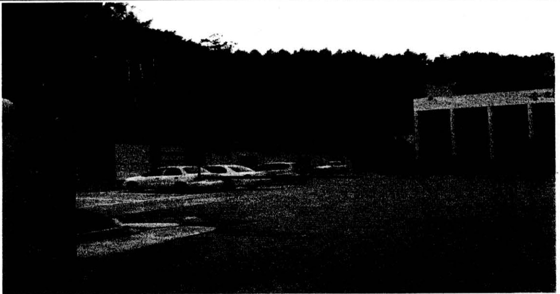
< 증축대상건물 원경 >