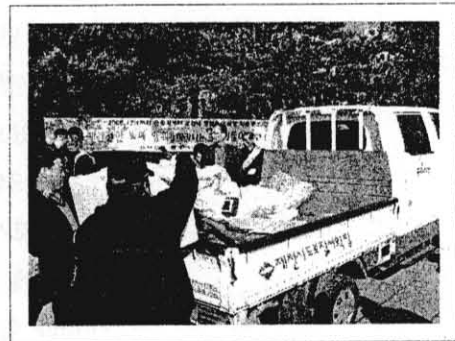
< 청전4공원 계도활동 >