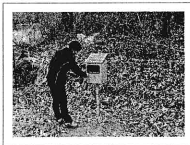
< 전기목책기 설치사업 >